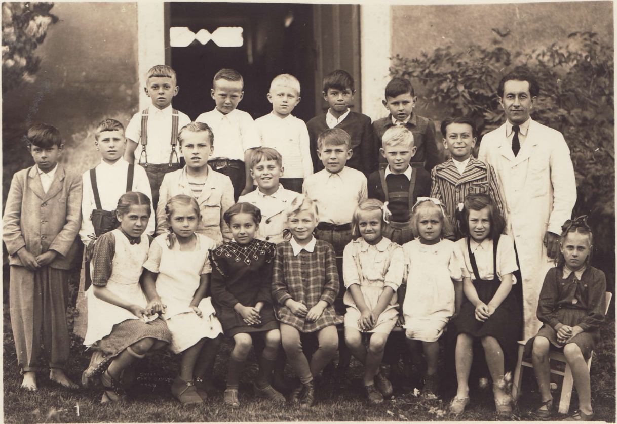
1. tř. obecné školy v Černolicích.