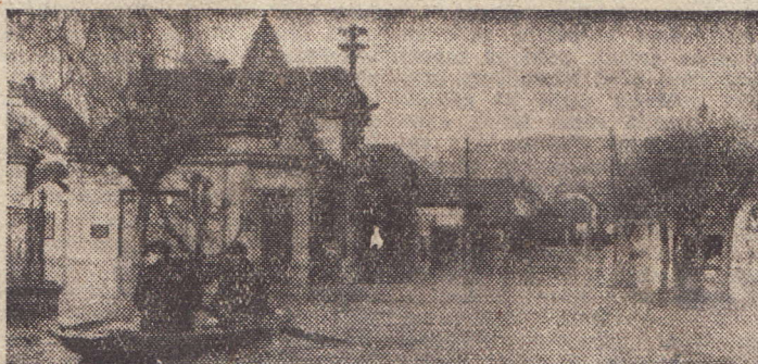
Tam, kde jindy člověk mohl klidně jít pěšky, dnes musí si vzít na pomoc loďku. Snímek z Dobřichovic

Ale to se již probouzelí lidé v lenu, po pás nebo utěci do vyššího patra a čekati na pomoc. Kdo viděl nebezpečí, měl čas vykřiknout na ženu a děti, ale to již byl zatopený sklep, plavala lize obléci a pryč — vodou po ko-