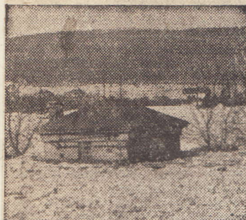
V Dobřichovicích jsou bez elektrického proudu. Elektrárna se ocitla v zajetí dravé vody a ledové tříště

Obce Dobřichovice, Lety a Řevnice pod vodou — Osmikilometrová barikáda z ledových ker Poslední stav v pondělí v noci: bariéra prolomena, od Modřan až po Radotín utvořena nová