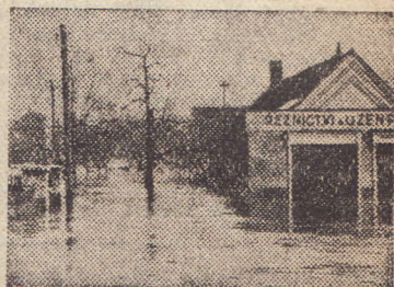
Dobřichovické ulice připomínají Bendtky

nutno opřít se proti tlaku sveně a na útěk... Ve třech, v pěti minutách bylo po všem. 200 domů zatopeno, 60 rodin bez přístřeší.